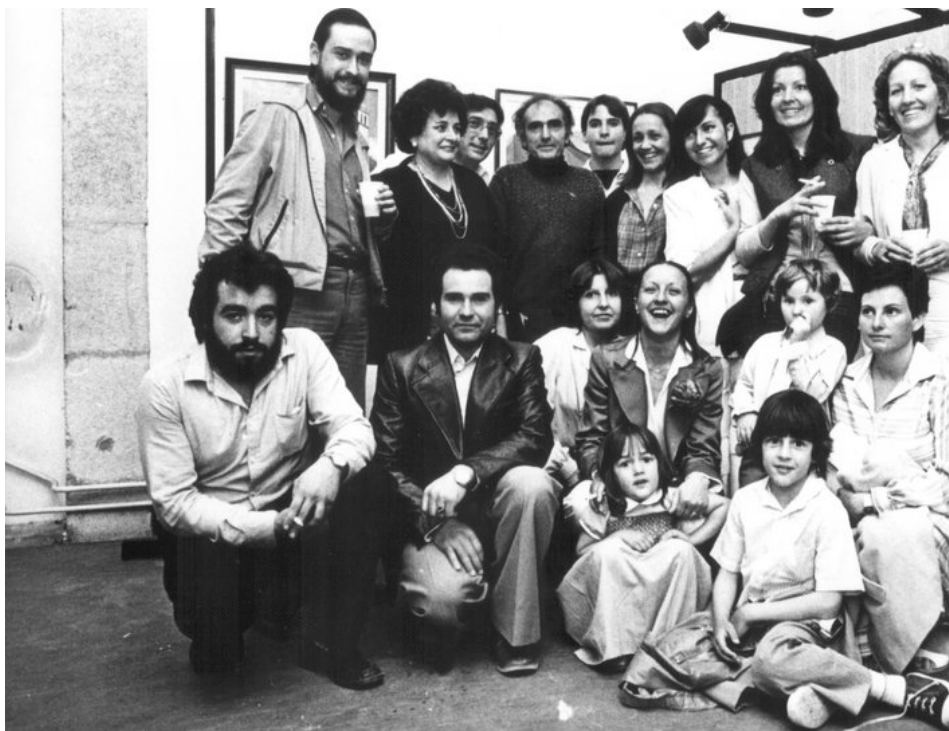
Alumnes de l'artista