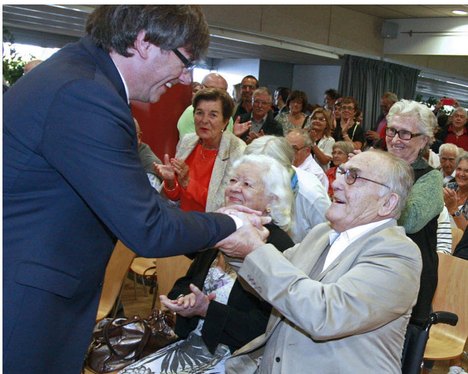
El president Puigdemont saluda Fita i Àngela Rodeja, durant un recent acte de reconeixement a la parella Foto: LLUÍS SERRAT.